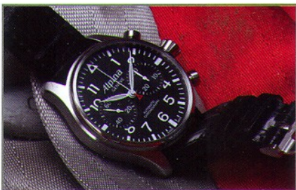
La Startimer Pilot est déclinée en plusieurs versions, dont un chronographe.